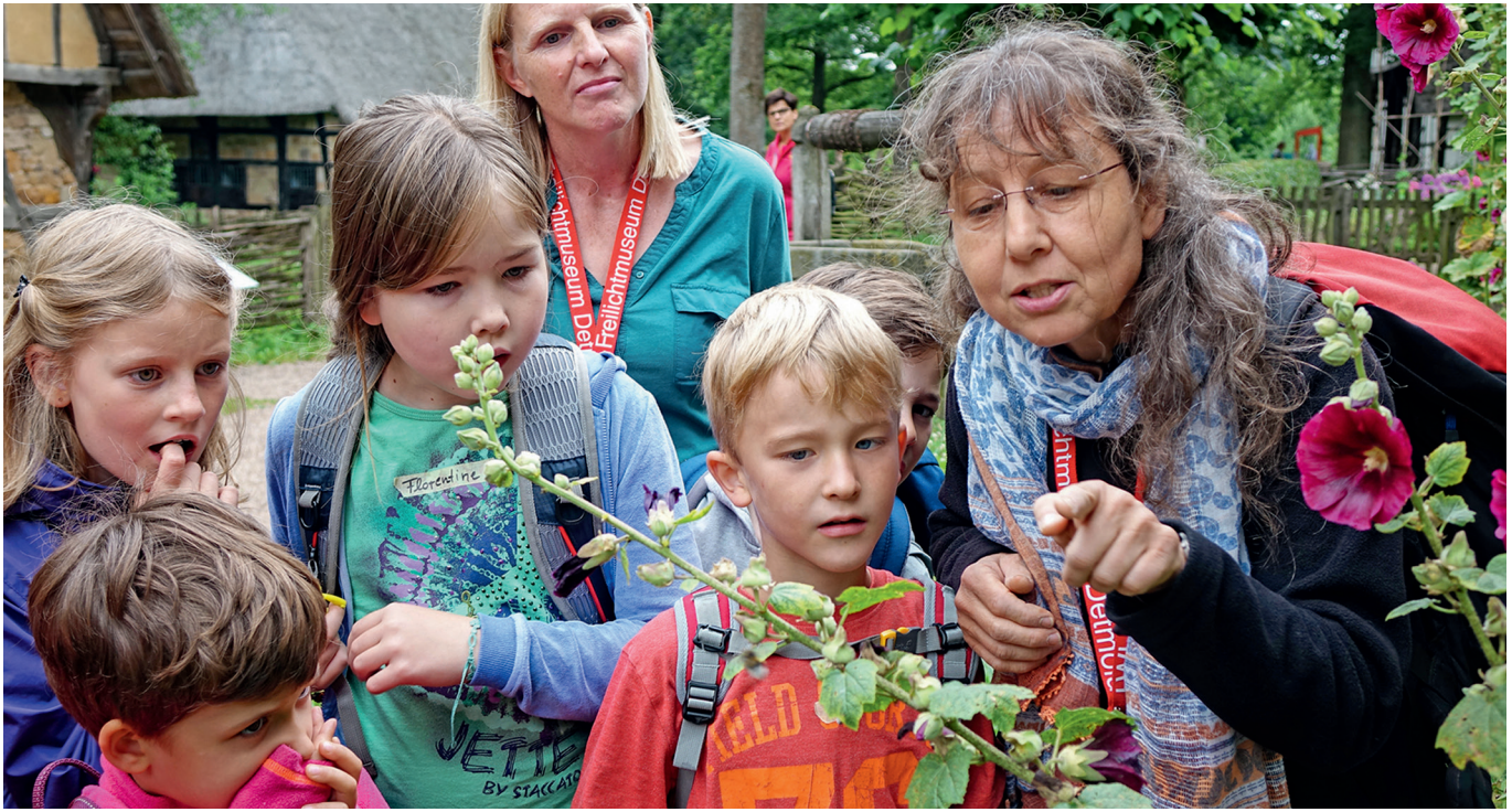
Das Freilichtmuseum Detmold entwickelt eine neue Strategie: «ökologisch – digital – partizipativ». / Le musée en plein air de Detmold déploie une nouvelle stratégie: «écologique – numérique – participative».

fördert eine saubere, «grüne» Mobilität von Mitarbeitenden und Publikum, formuliert Energieziele und installiert ein Recyclingmanagement. Es achtet auf ökologische Ausstellungsmaterialien und vergibt Aufträge an das regionale Gewerbe. Das «grüne» Museum formuliert Ziele für die Optimierung des Ressourcenverbrauchs und die Reduktion von CO 2 -Emissionen.