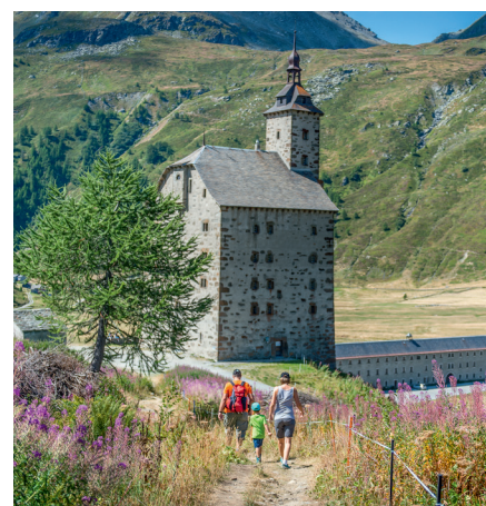
Im Ecomuseum Simplon ist Nachhaltigkeit Programm. / À l'écomusée du Simplon, la durabilité est tout un programme.

L'exigence de durabilité touche le monde des musées. Des campagnes de sensibilisation incitent non seulement les associations de musées et les institutions culturelles mais aussi les musées indépendants à développer une stratégie durable et leur proposent de réexaminer leurs propres pratiques. De nombreux musées se battent pour survivre économiquement – l'exigence de durabilité sur tous les plans semble alors rapidement excessive. Pourtant, l'opposition profonde entre le devoir de durabilité des musées et leurs responsabilités écologiques, économiques et sociales inspire un changement institutionnel. En effet, la durabilité offre de nombreuses opportunités; elle n'exige pas seulement l'accès aux différents publics, mais également un changement au sein même du musée: l'interdisciplinarité, la coopération à tous les niveaux de hiérarchie, l'implication participative de tous les acteurs, une attitude respectueuse et une communication ouverte font partie du développement de nouvelles formes d'organisation et de structures flexibles axées sur les processus. Le mot-clef du «musée centré sur l'être humain» donne des suggestions à ce sujet.