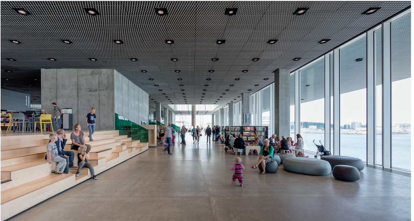
Das Dokk1 in Aarhus interprète la Bibliothèque radical um: Im Zentrum stehen Menschen und ihre Kommunikation. / Le Dokk1 à Aarhus réinterprète la bibliothèque d'une façon radicale, en mettant le focus sur les personnes et leur communication.

au cours des dernières années par des associations ou des spécialistes des musées sur le thème de la durabilité dans les musées. L'Australie et principalement la Grande-Bretagne ont été des pionnières dans la formulation de critères de durabilité pour les musées 3 , notamment avec la campagne de durabilité de l'Association des musées britanniques lancée en 2008. Il existe également des textes fondateurs, des directives, des check-lists et des indicateurs inspirateurs émanant des États-Unis ou de Roumanie. Ces documents encouragent la Suisse à approfondir à son tour son approche du sujet: peut-être l'Association des musées suisses (AMS) lancera-t-elle une étude afin d'obtenir un aperçu des stratégies de durabilité dans les musées suisses? Ou encore échafaudera-t-elle un plan d'action en faveur de l'amélioration de la durabilité des musées?